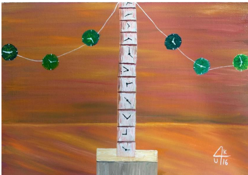
Inmemorian. (2016). Óleo sobre lienzo, Miguel Alberto González González