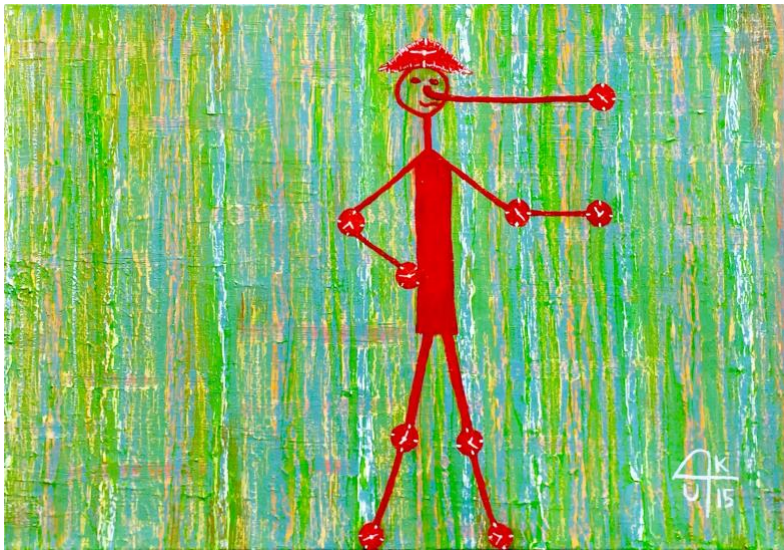
Intoxidados con cronos. (2015). Óleo sobre lienzo, Miguel Alberto González González