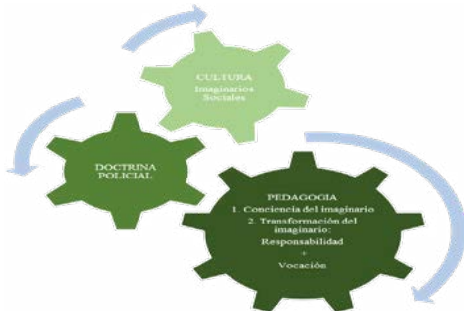
Figura 1. Engranaje de los imaginarios policiales

Para concluir, de acuerdo a lo analizado a través de la observación participante y teniendo en cuenta los diferentes roles que cumplen los autores, se elabora el siguiente esquema en el cual se resume lo expuesto y de donde surge la estrategia pedagógica propuesta: