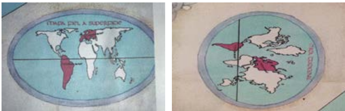
Figura 1: mapa de perspectiva eurocêntrica (mapa tradicional) e de dimensões territorial real (mapa fiel da superfície)

O fragmento elaborado por Eduardo Galeano revela uma cartografia de escala propositalmente distorcida, um mapa tradicional, colocando a Europa no centro do mundo e a América Latina numa localização considerada menos privilegiada, além das distorções territoriais de outros continentes.